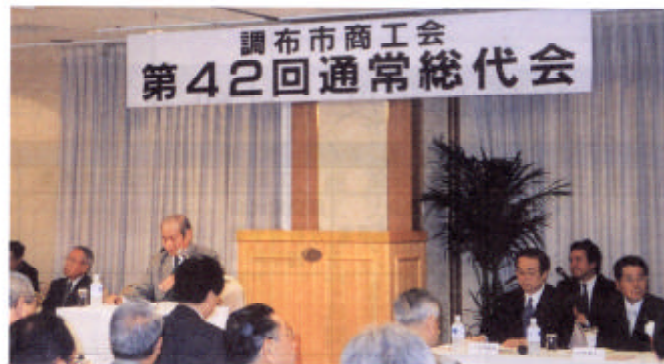
調布市商工会 第42回通常総代会